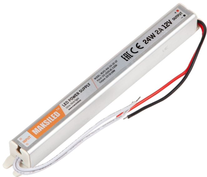
Модель: MLPS-NW-24-12-UT Размеры: 176*18*18 мм MLPS-NW-24-24-UT