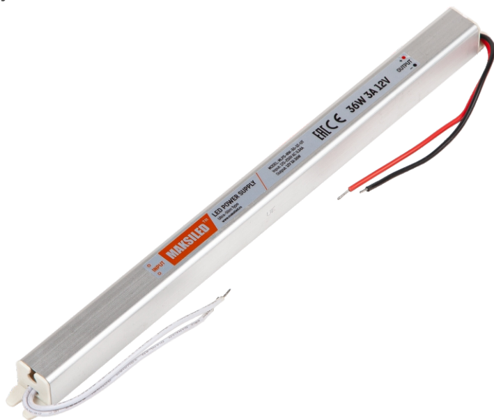
Модель: MLPS-NW-36-12-UT Размеры: 283*18*18 мм MLPS-NW-36-24-UT